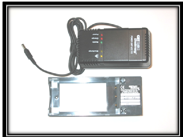
Neuer Ladeadapter (Artikel ATB-09.00032.09) mit Ladeschale (Artikel BE023-00125)