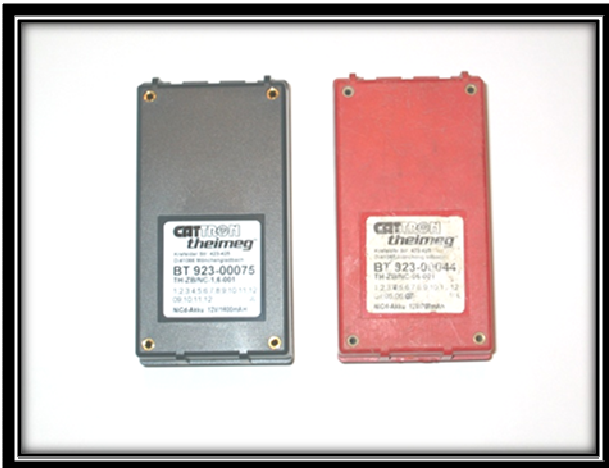
12V Akku Easy/Mini (Artikel BT923-00075)

Dies hat zur Folge, dass ältere Ladegeräte nicht mehr verwendet werden können, da diese nicht für NiMH-Akkus ausgelegt sind. Diese müssen bei Bestellungen entsprechend ersetzt werden.